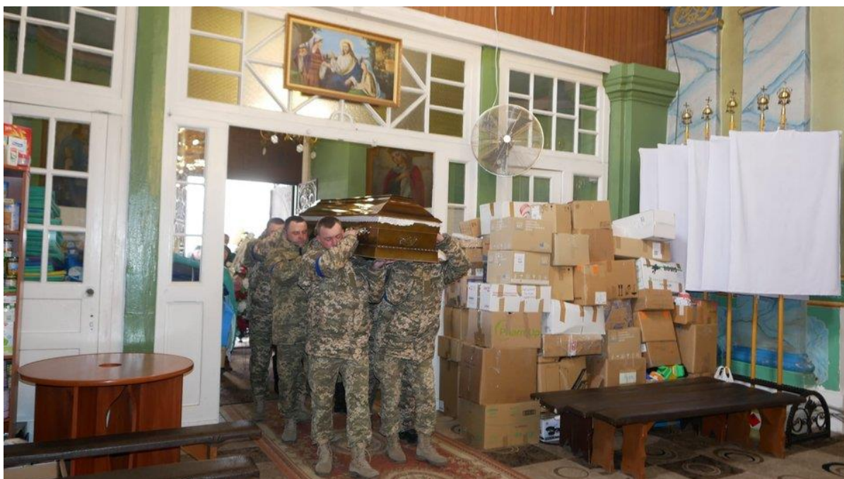
У Збаражі в Успенській церкві прощаються з загиблим воїном

Голова Збаразької громади розповів, що похорон розпочнеться 1 квітня о 13-ій годині. Поховають військового на центральному збаразькому кладовищі неподалік могил інших військових, які загинули у російсько-українській війні.