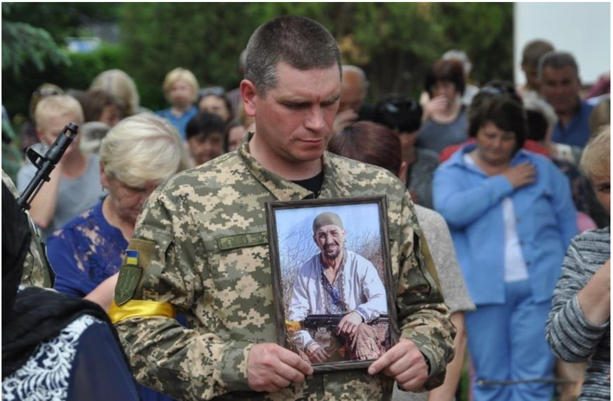
Автор: Любомир Габруський