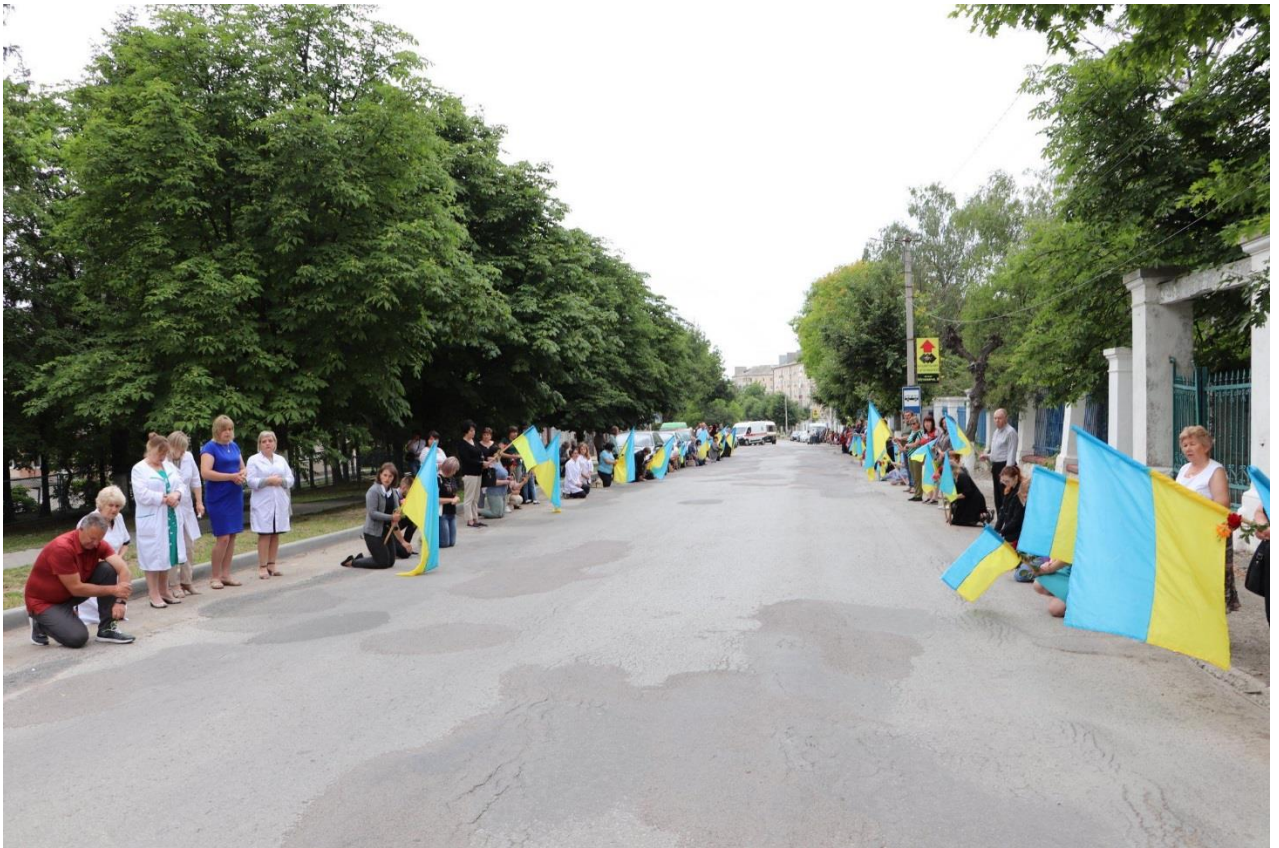
У Борщівській громаді приспустили прапори і оголосили триденну жалобу – від 16 до 18 червня.