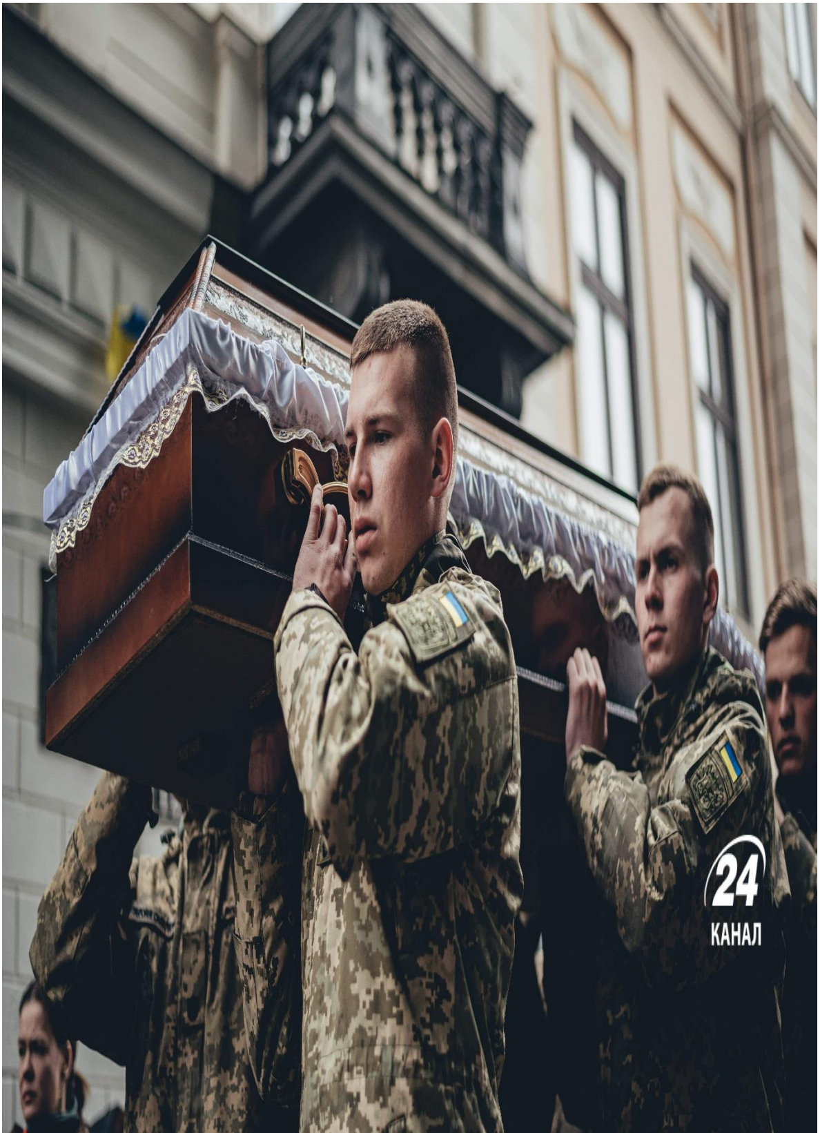
Прощання з Руфом

Вже 3 березня відбувся його перший бій. Руф писав, що його бригада стоїть у Попасній на Луганщині.