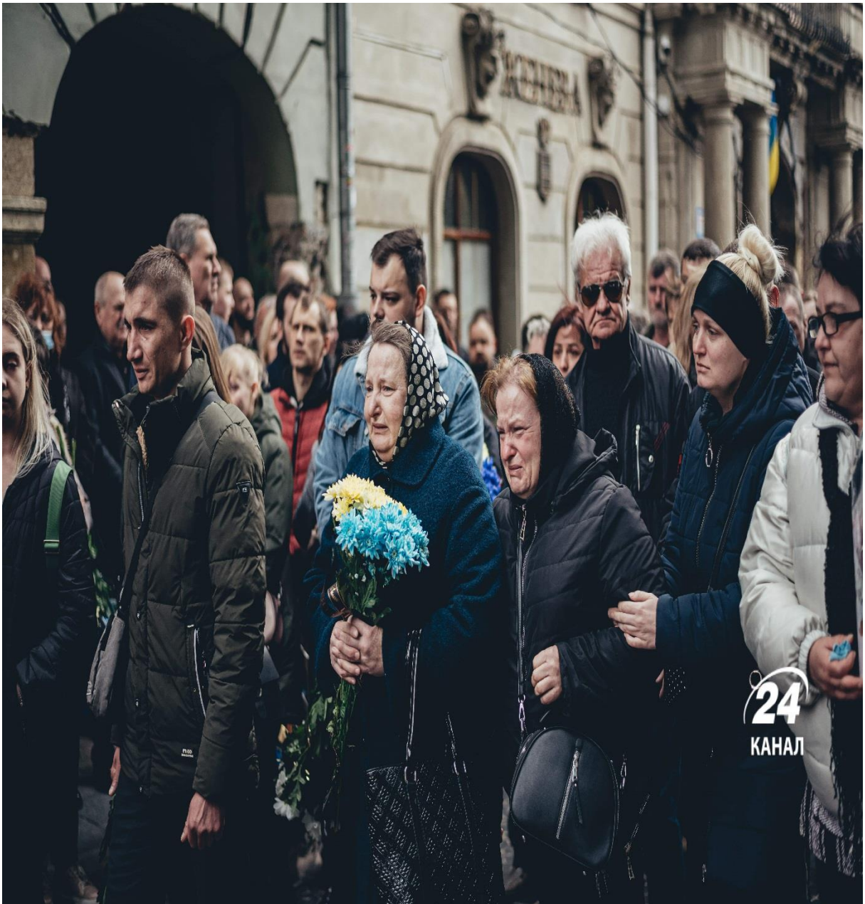
Церемонія прощання