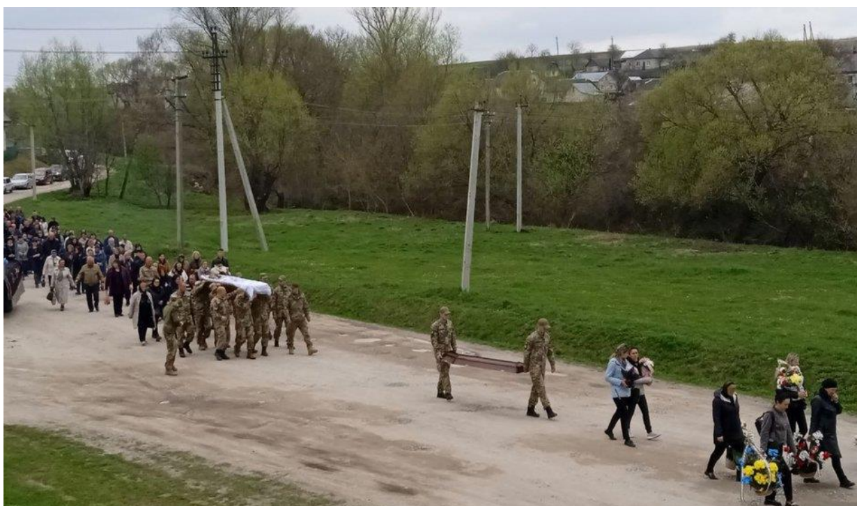
Прийшли попрощатися, рідні, друзі та побратими

"Завжди допомагав нам. Мав техніку, трактора. Ніколи не відмовляв. Також він працював в лісі, допомагав з дровами. Завжди був такий дружлюбний, добрий чоловік. Пам'ятаю його таким".