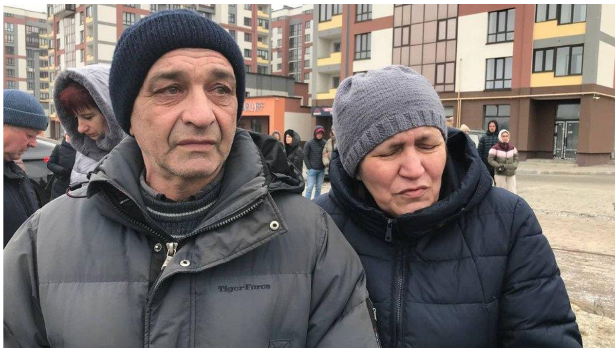
Родичі загиблого бійця