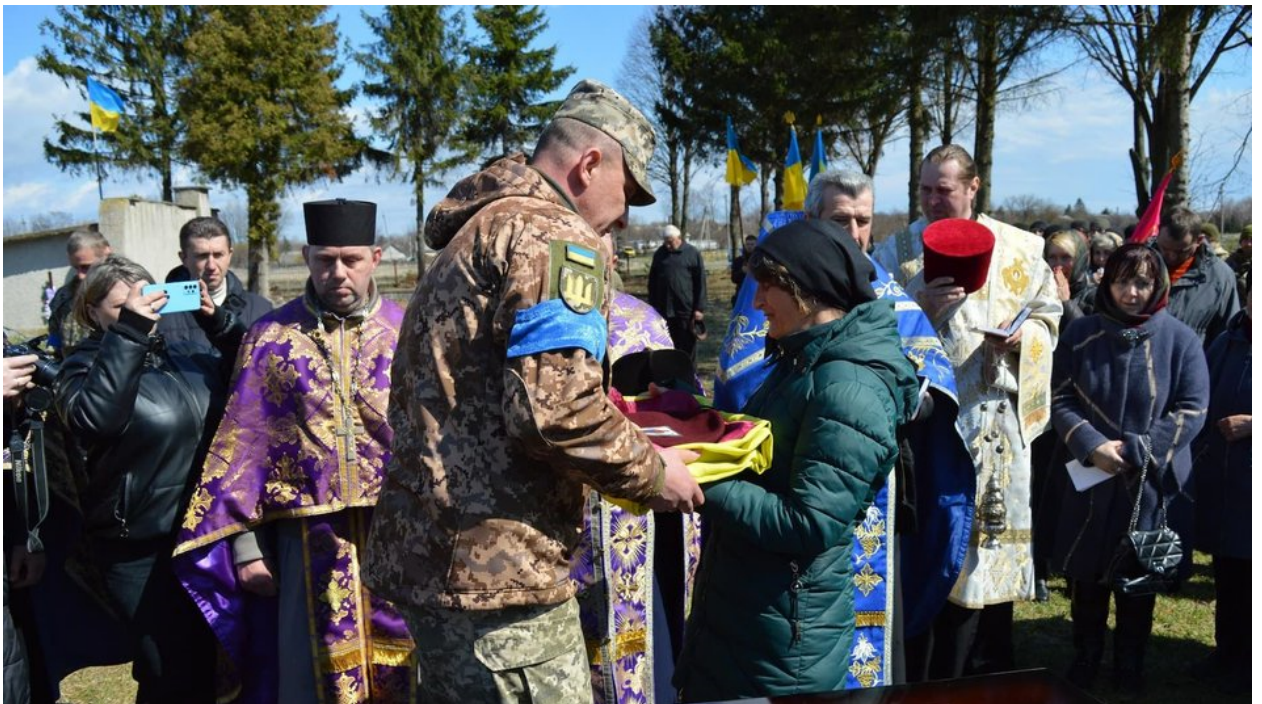
Матері передали берет, який носять десантники