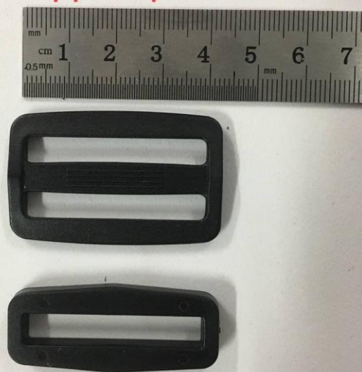
Пряжка двоцілінна/ одноцілінна