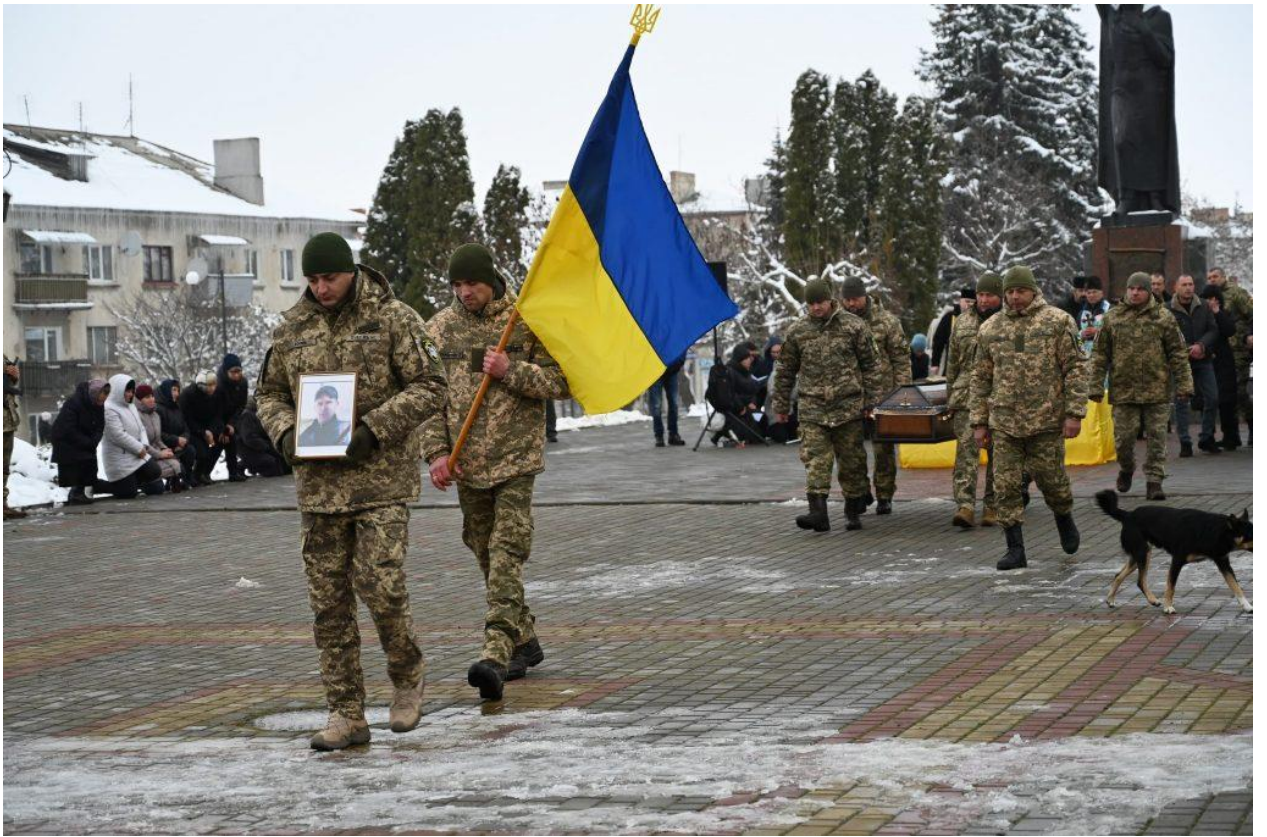
Поховали загиблого 23 листопада у рідному селі Молотків. Вічна пам'ять Герою!