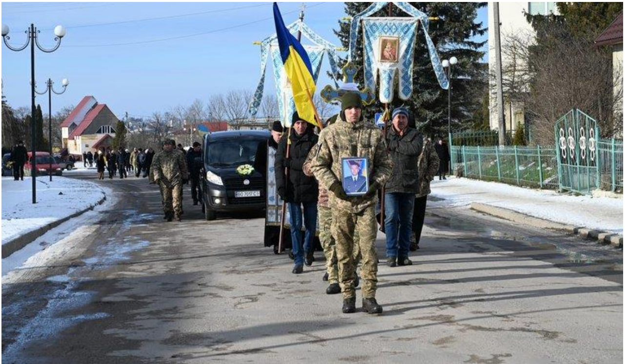
Похорон.