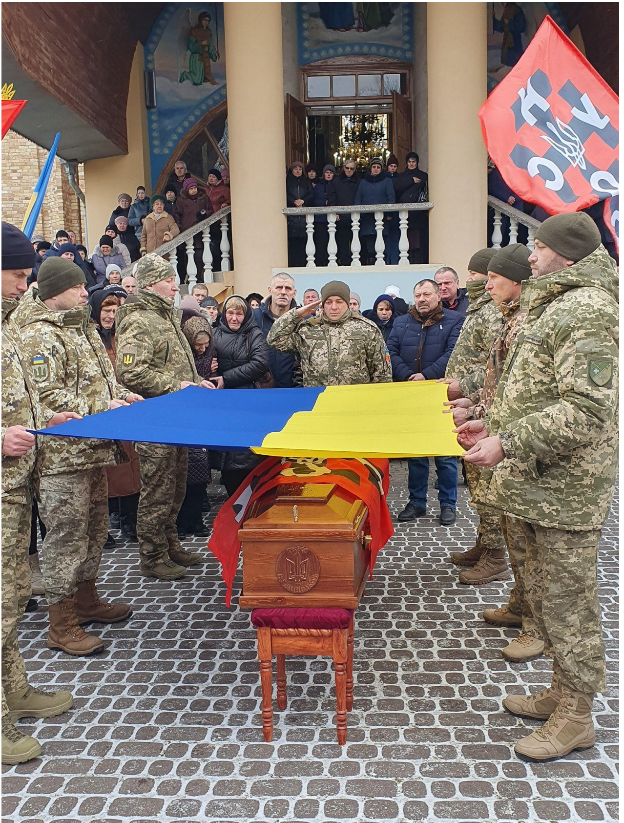
Він знімався в кількох художніх та документальних кінострічках.