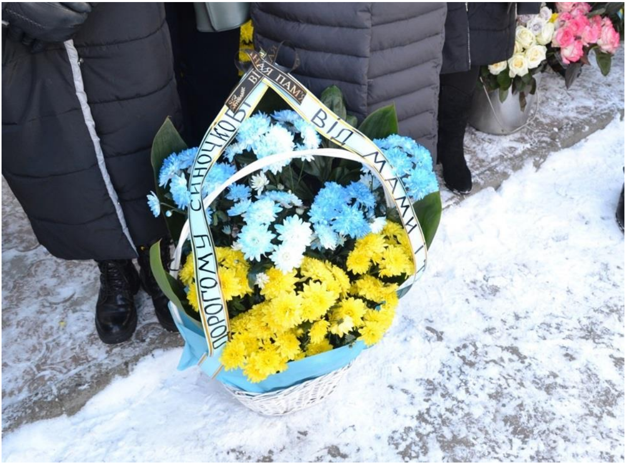
Автор: Тетяна Лякуш