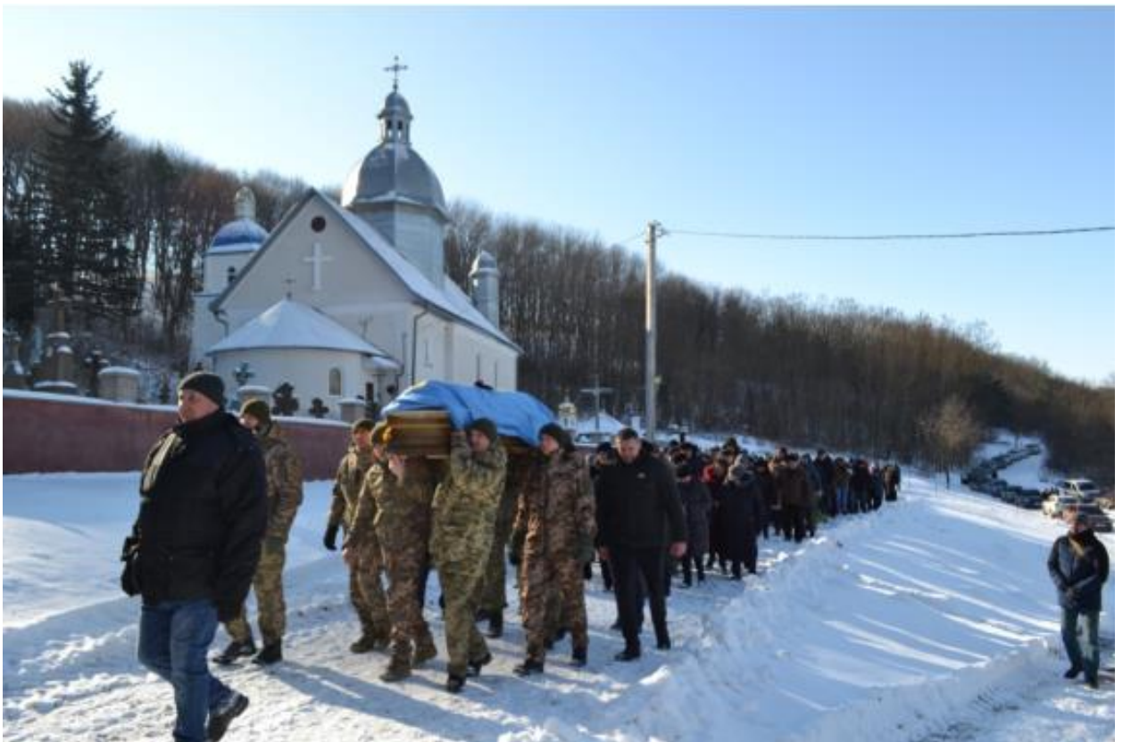
Потрійний автоматний залп – на честь і славу Героя...