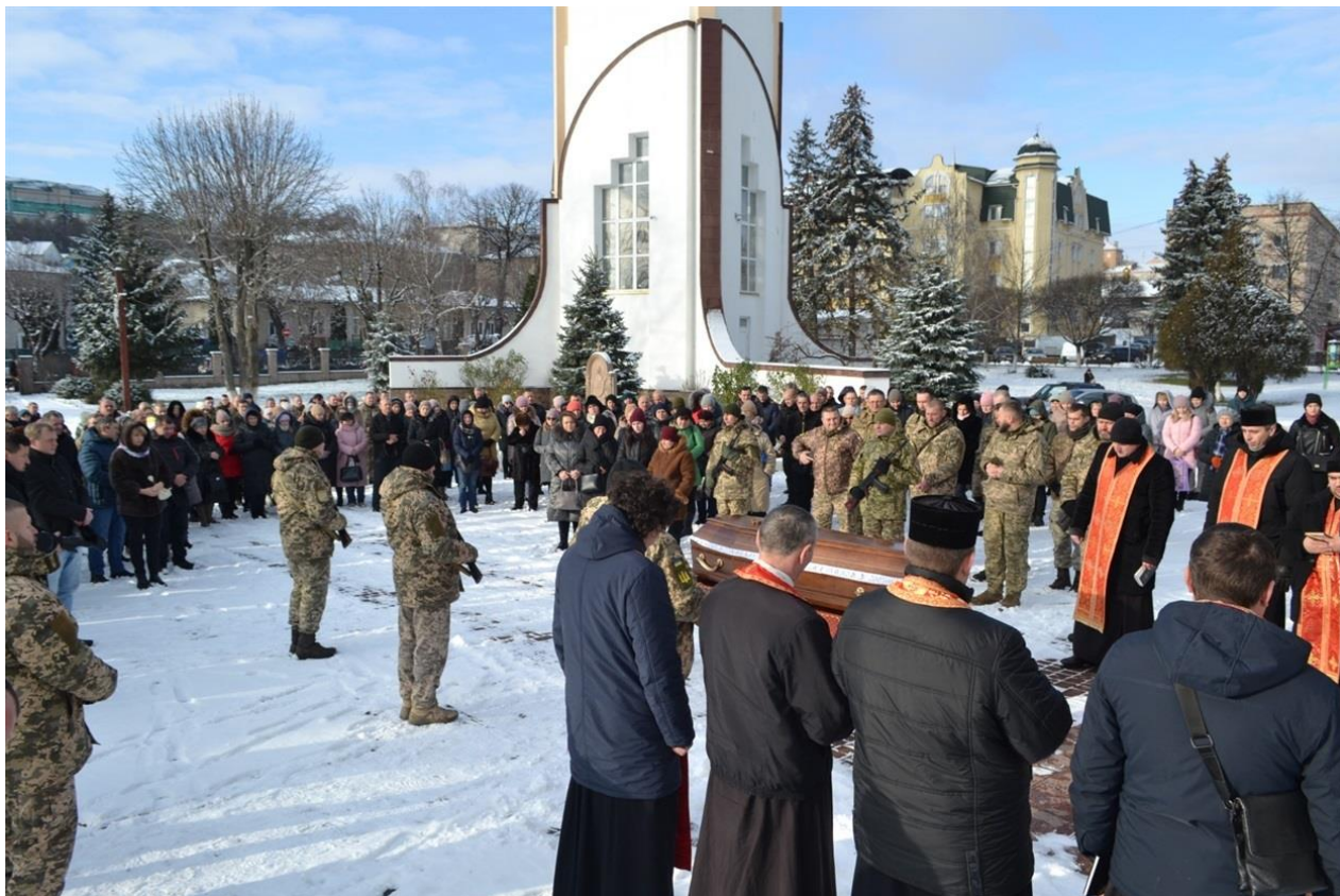
Автор: Тетяна Лякуш