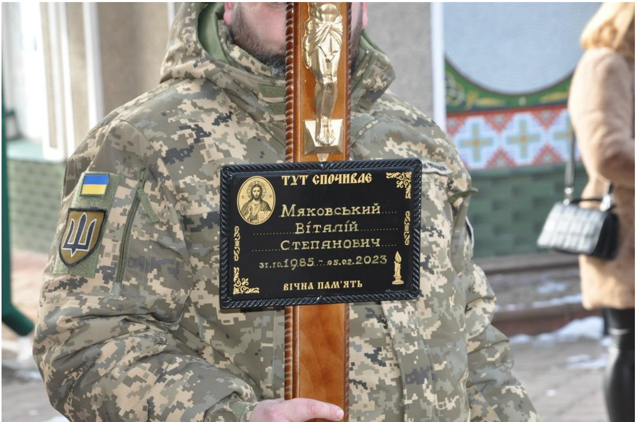
Автор: Любомир Габруський