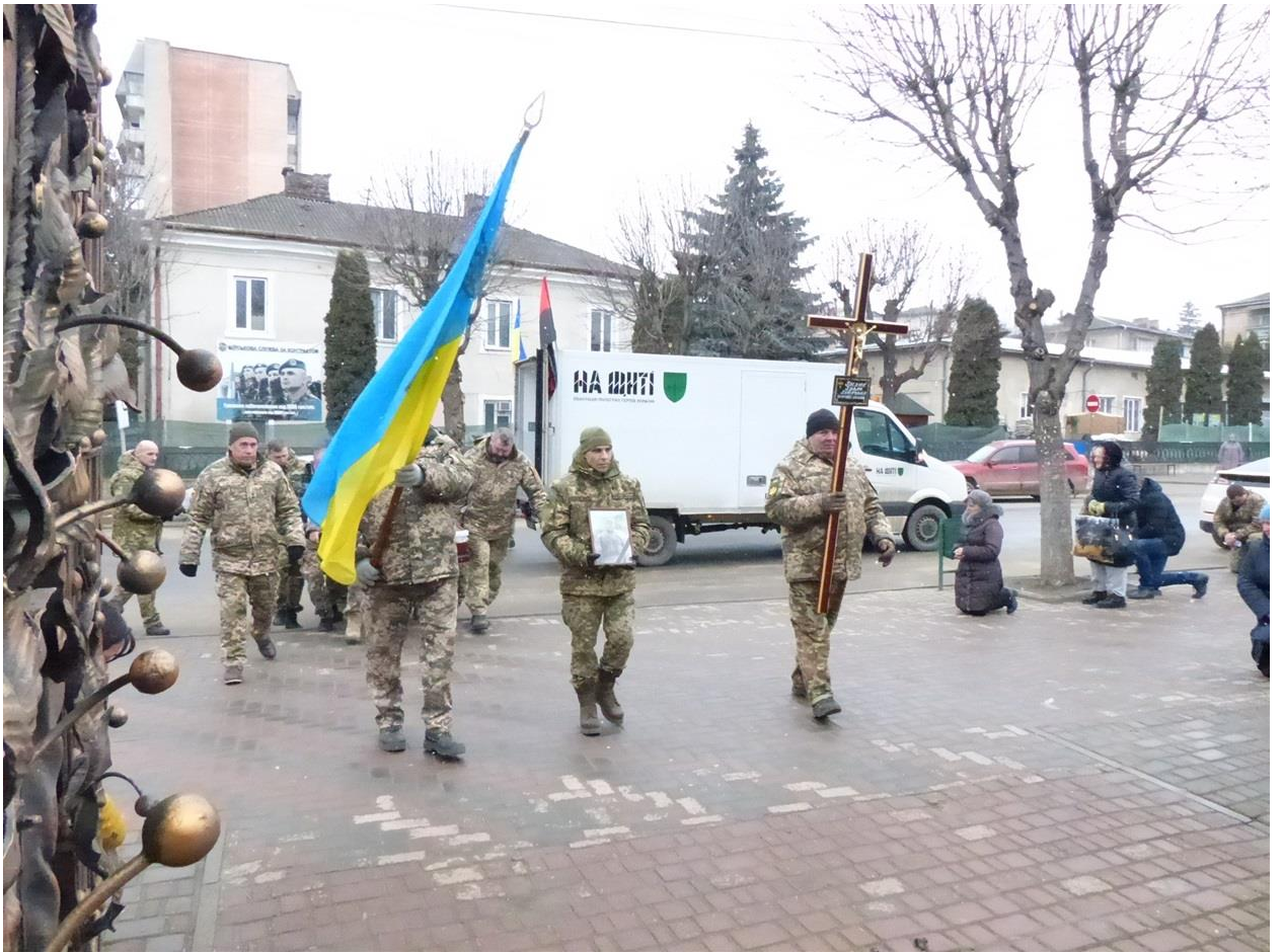
Автор: Любомир Габруський

Служив стрільцем-санітаром гірсько-штурмового відділення гірсько-штурмової роти в/ч А3892П. Призваний на військову службу Чортківським РТЦК та СП ще у січні 2020 року. У повідомленні останнього про смерть воїна значиться, що помер 28 січня у військовому шпиталі м. Дніпро.