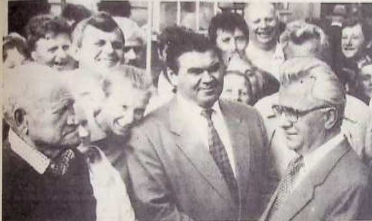
Леонід Кравчук під час зустрічі з виборцями Тереховлі.

УВАГА ВСЬОГО СВІТУ ЗВЕРНЕНА НИНІ ДО ТЕРЕБОВЛІ, ДЕ ВИРІШУЄТЬСЯ ДОЛЯ НЕЗАЛЕЖНОЇ УКРАЇНИ ШАНОВНІ ВИБОРЦІ! ПРОЯВІМО ВИСОКУ ГРОМАДИНСЬКУ АКТИВНІСТЬ І ПОЛІТИЧНУ СВІДОМІСТЬ, ВІДАЙМО СВОЇ ГОЛОСИ ЗА ЛЕОНІДА КРАВЧУКА