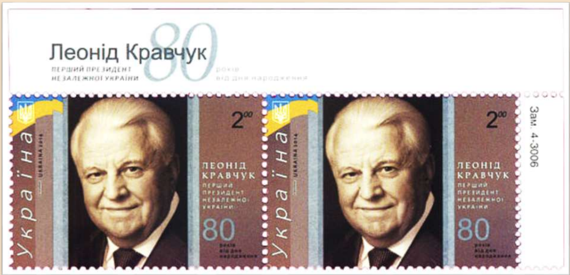
Ювілейна поштова марка до 80-річчя від дня народження Леоніда Кравчука