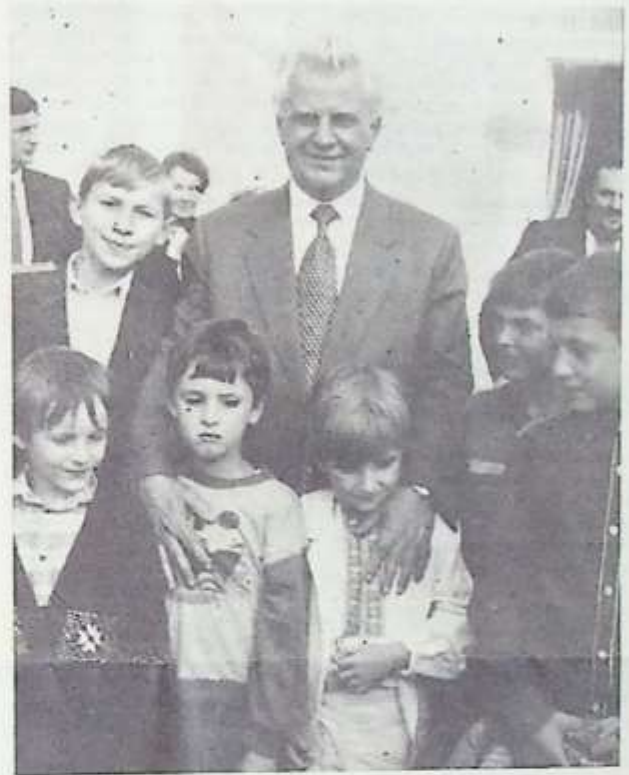
На знімку фотолюбителя Наталії Хвалибоги зафіксовано зворушливу картину: экс-Президент Леонід Кравчук і милі тербовлянські діти — сучасне і майбутнє незалежної України.