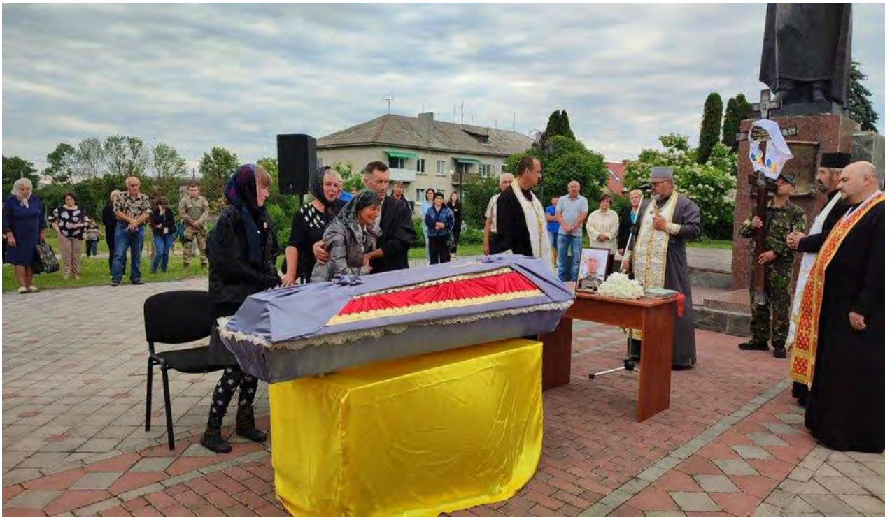
Вшанувати військовослужбовця прийшли рідні.

https://suspilne.media/253516-u-gromadi-na-ternopilsini-zustrili-tilo-zagiblogo-vijskovosluzbovca/