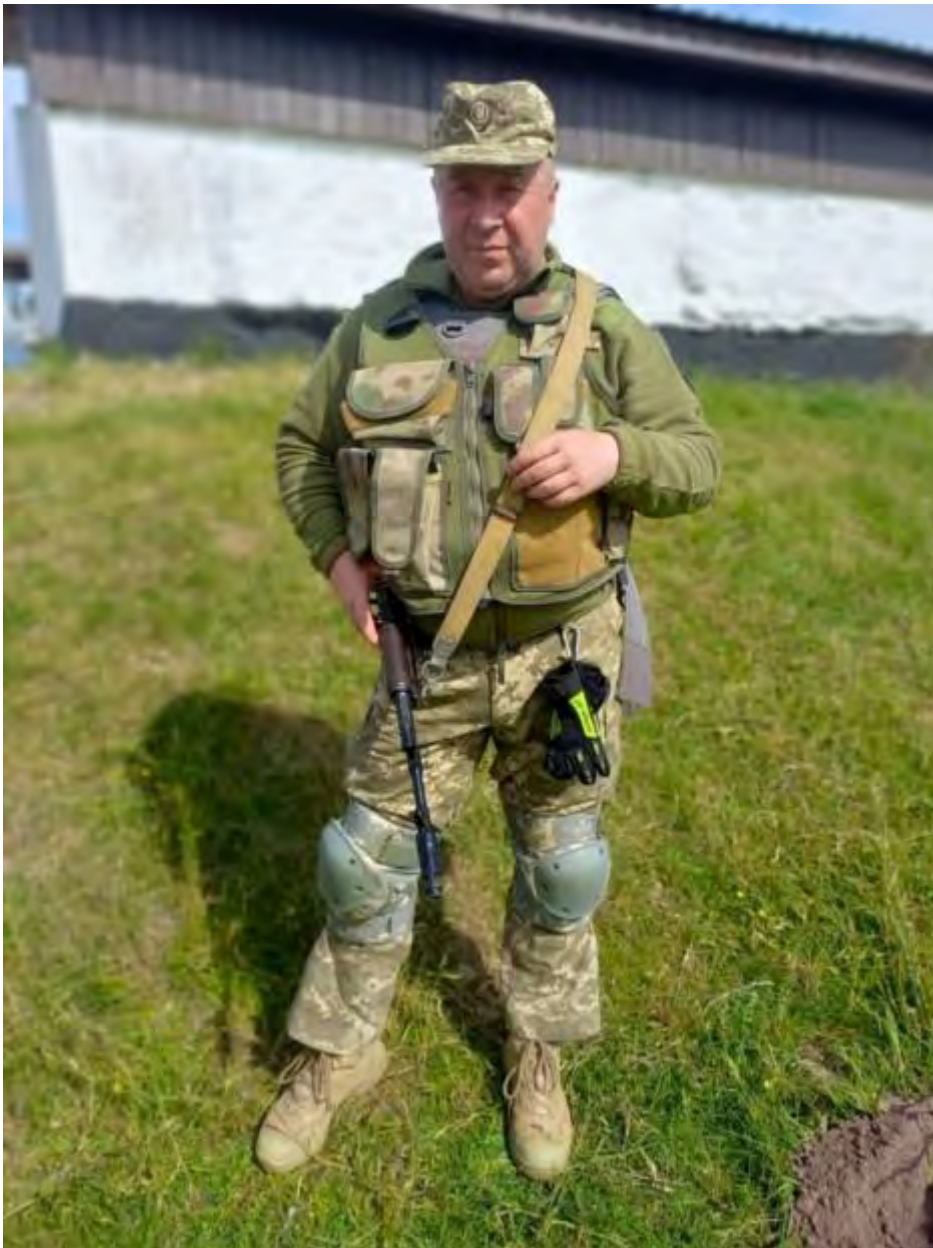
Поховали Героя в його рідному селі Почапинці поряд із символічною могилою борцям за волю та незалежність України «Герої не вмирають».