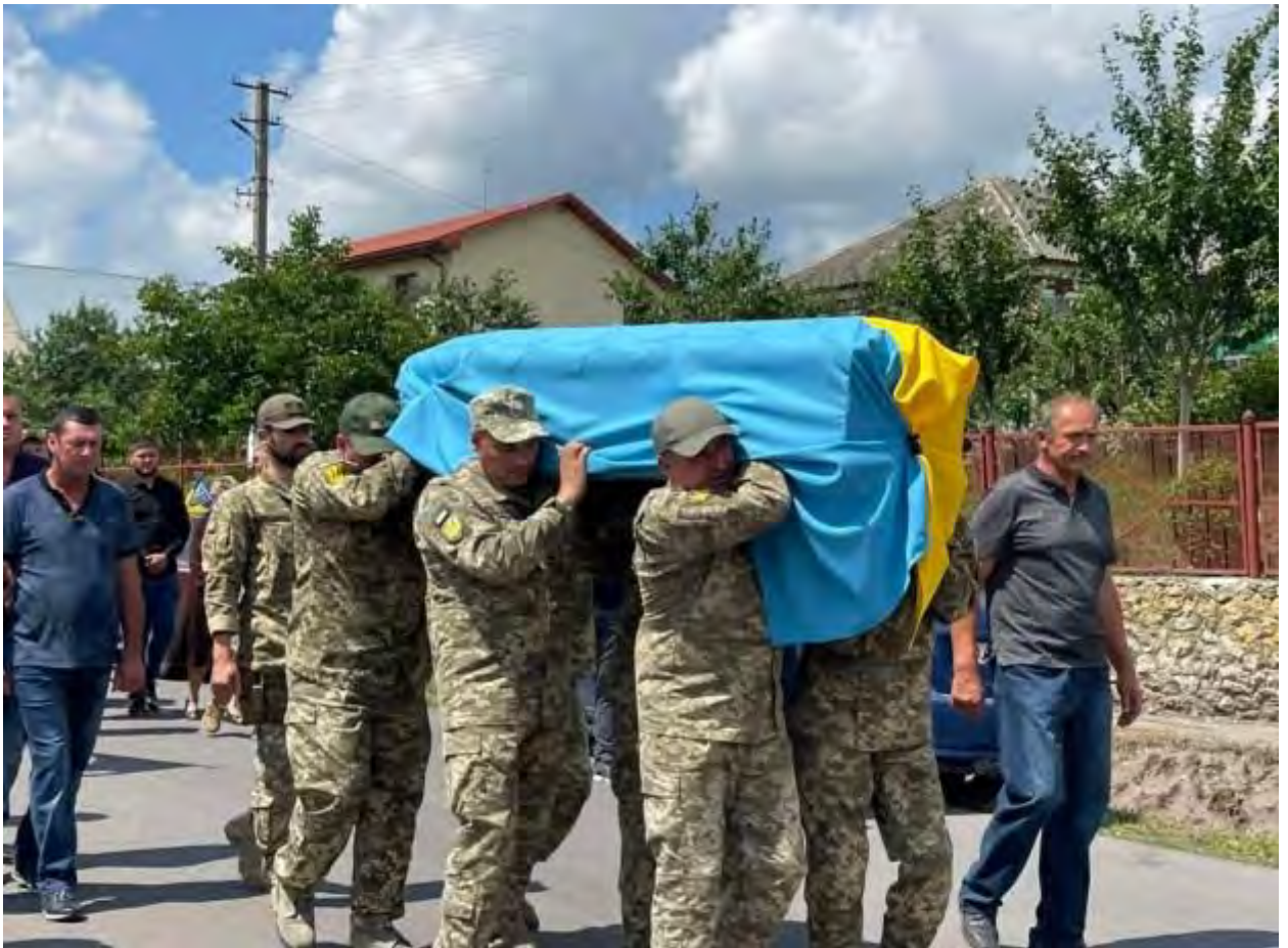
Вічна слава Героям!