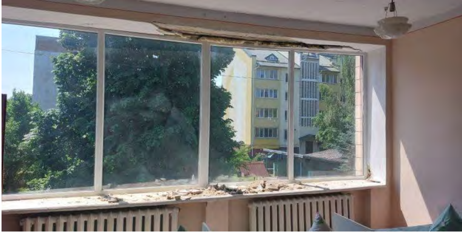
Ударна хвиля пошкодила заклади освіти у Чорткові

У суботу, 11 червня, окупанти обстріляли чотирма ракетами «Калібр» місто Чортків на Тернопільщині. Через це постраждали 23 людини, серед яких – дитина, 4 п'ятиповерхівки, газова магістраль та заклади освіти. Про це пише «Файне місто» з посиланням на Чортківську міську раду.