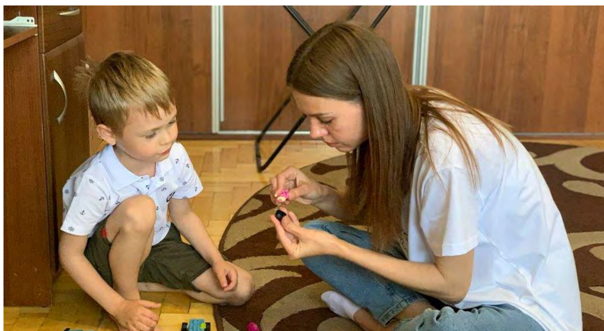
Жителька Донеччини з сином.

Тут жінка із сином живе в орендованій квартирі. Жінка розповідає, день, коли розпочалася війна, запам'ятала на все життя.