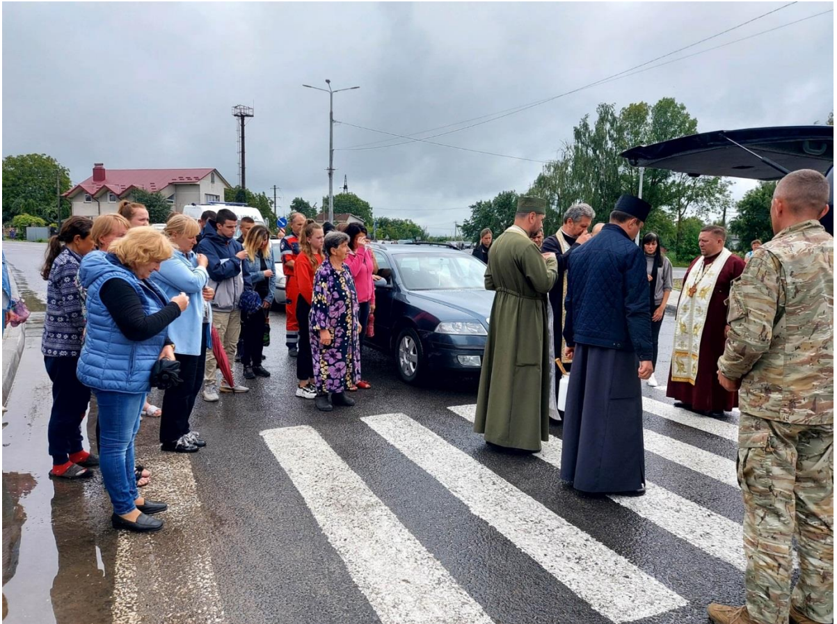
Заупокійне богослужіння відбулося у домі загиблого. Та чин прощання у Соборі Преображення Господнього.