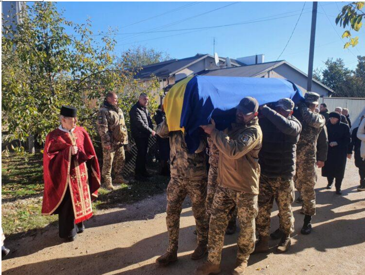
Загинув Герой з Підволочиської громади.