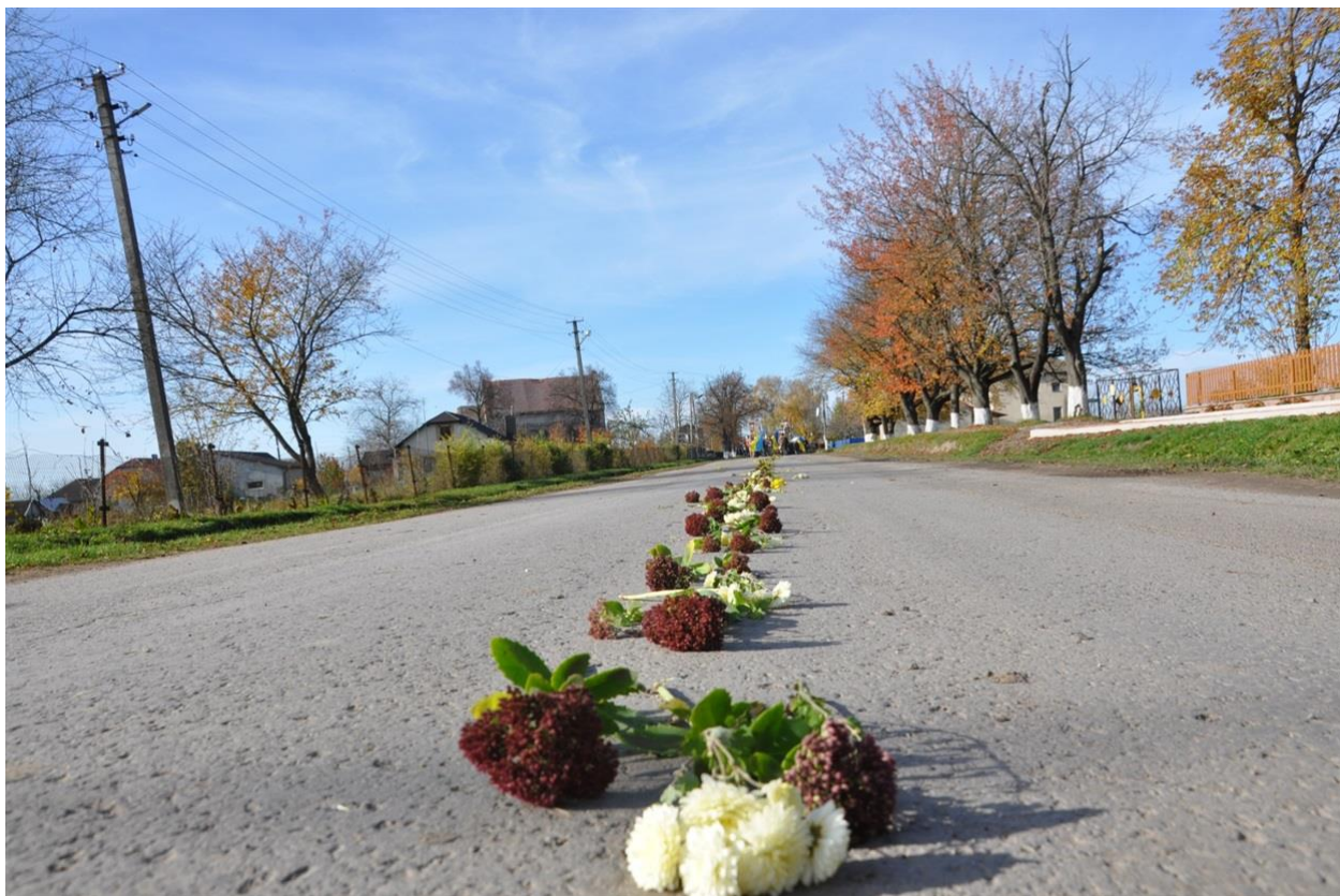
Автор: Любомир Габруський

За вікном автівки спостерігається така ж картина, як і трохи більше тижня тому: крізь усі села, куди прямував траурний кортеж, дорога всяяна осінніми квітами. Так само від звиняцького повороту до обійстя загиблого воїна, а це добрих два кілометри.