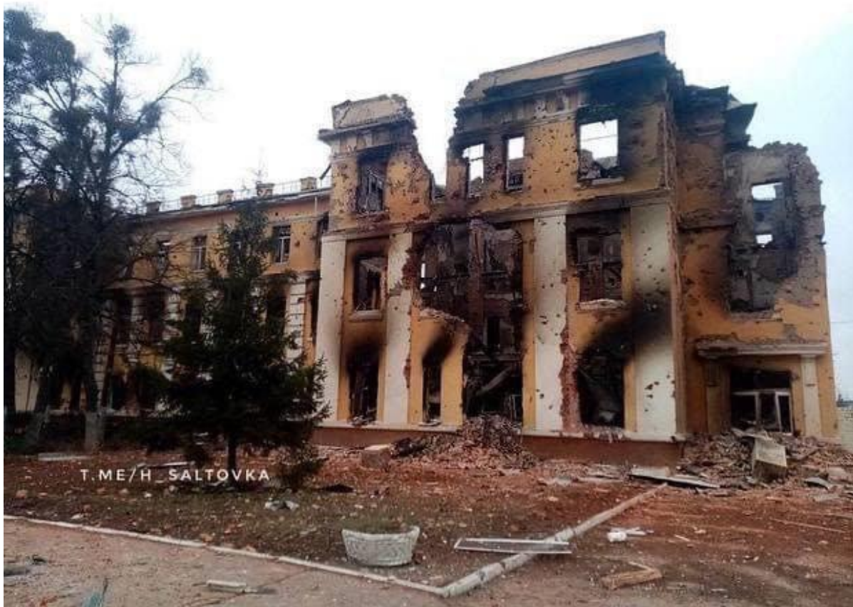
кола у Харкові, 28 лютого.

На вулиці підійшла до військового та питаю — що мені робити? Я тоді перший раз розгубилася. В цей час гради почали летіти. Мені допомогли пройти в підвал, з якого я бачила, як бомбили дитсадок, видно було як палав 16-поверховий будинок, там, де раніше ховалась у підвалі... Пробыла у цьому підвалі одну добу, а потім звідти мене завезли на Південний вокзал.