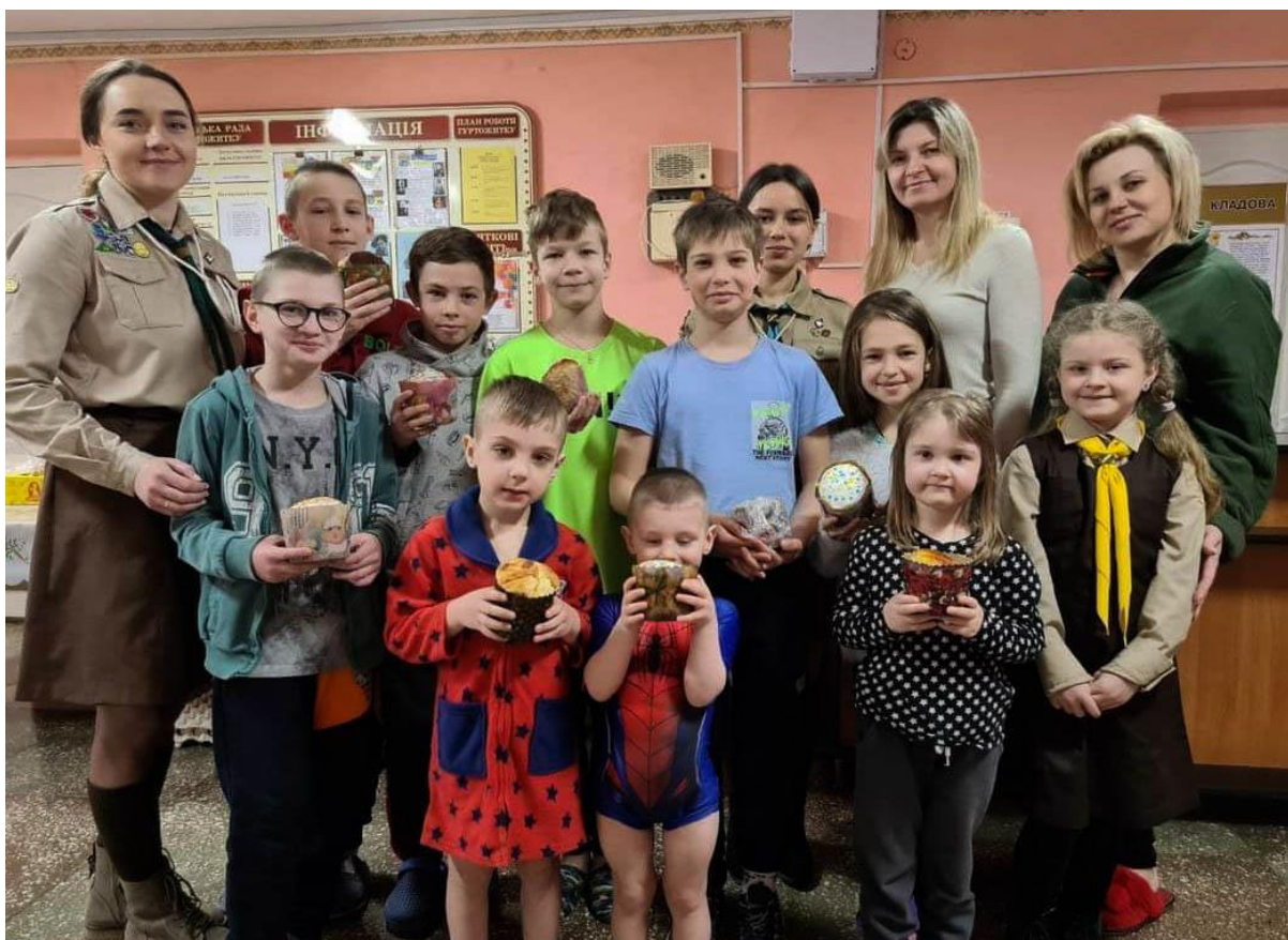
Діти у тимчасовому центрі для ВПО у Тернополі