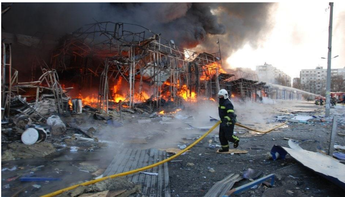
Пожежа на ринку у Харкові після обстрілу, 16 березня.

У Харкові мій бізнес просто згорів за три-чотири тижні. Перед тим, як згорів торговий центр Барабашово, згорів центр біля метро Героїв праці — там у мене був бізнес, автозапчастини. У бізнесі я втратив усе. Але в Тернополі добрі люди допомогли і мені, і дружині знайти роботу. Мене запросив до себе на роботу приватний підприємець, який також волонтерить. Працюю тут офіційно.