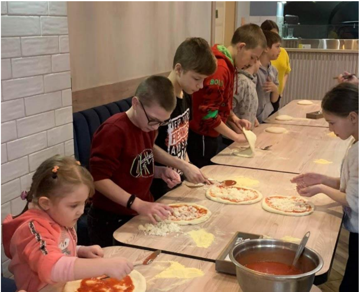
Гуманітарна допомога від польських волонтерів