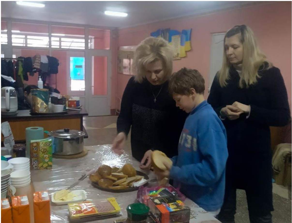
Центр для ВПО у Тернополі організовує щоденне харчування для вимушених переселенців

Хочу сказати, що у Тернополі маємо велику підтримку від місцевих та міжнародних неурядових організацій. Приємно, що в такий важкий час є організації, які готові прийти на допомогу та роблять це від щирого серця. Допомагає Товариство Червоного Хреста України. Через управління освіти ортопедичними матрацами-розкладачками нас забезпечив Німецький Червоний Хрест — у наш гуртожиток привезли 136 ліжок. Психологічну допомогу ВПО та засоби гігієни за індивідуальними потребами надає чеська організація «Люди в біді». Тернопільська ГО «Відродження нації» консультує щодо правової допомоги та допомагає засобами гігієни. Представництво гуманітарної організації Medair у Тернополі надало переселенцям, які у нас проживають, постільну білизну, подушки, ковдри, рушники тощо.