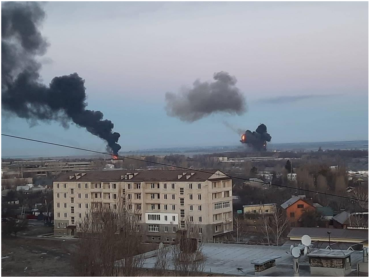
Харків, 24 лютого.

Наші військові сказали ховатися в глибину мікрорайону. Дівчата прибігли додому, їх трусило. Ми вирішили шукати підвал, куди б можна було заховатися — зайшли у підвал 82-го дому, там була дитяча студія, тому там був туалет, вода, світло. З діворою ми зайшли у підвал 24 лютого і просиділи 11 діб — на табуретці. Коли закінчувалася комендантська година, дівчата бігали додому, наш будинок поруч був, щоб щось взяти. Розмови йшли про те, як вибиратися, коли нічого не їздить. Я сама маю інвалідність другої групи. Одну мене не хотіли залишати, але я наполягала доньці — рятуй дитину. Аж тут до 5-ти поверхового будинку приїхав чоловік когось забирати, вони поїхали з ним. Ще одна моя внучка вже була у Тернополі. Їхали до неї потягом. 18 годин.