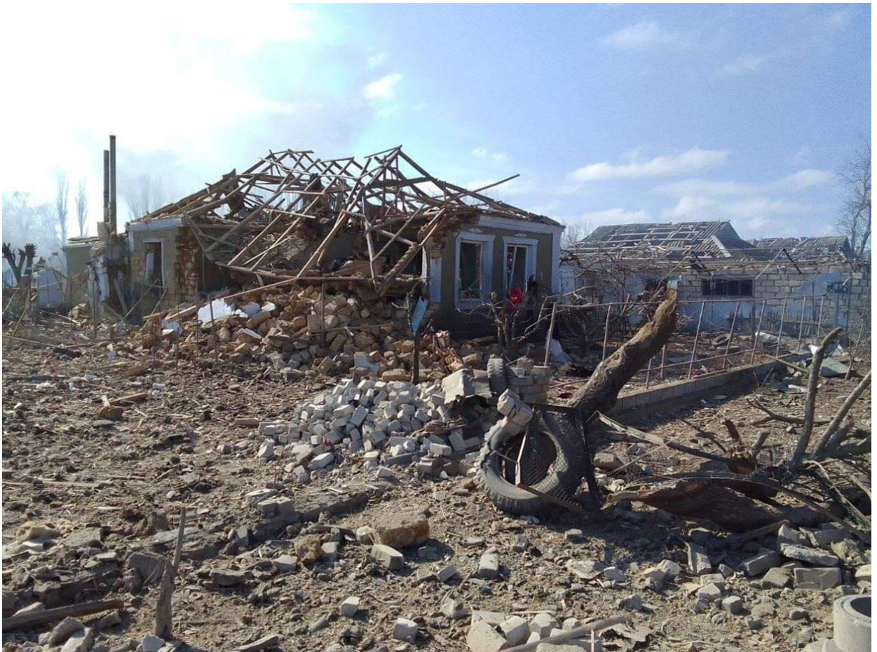
Будинок батьків у Баштанці

Але що ж, Баштанка прифронтова. Прилітає періодично і дуже сильно. Братові в город впав іскандер, вибуховою хвилею пошкодило дім. Зруйнована інфраструктура, стадіон.