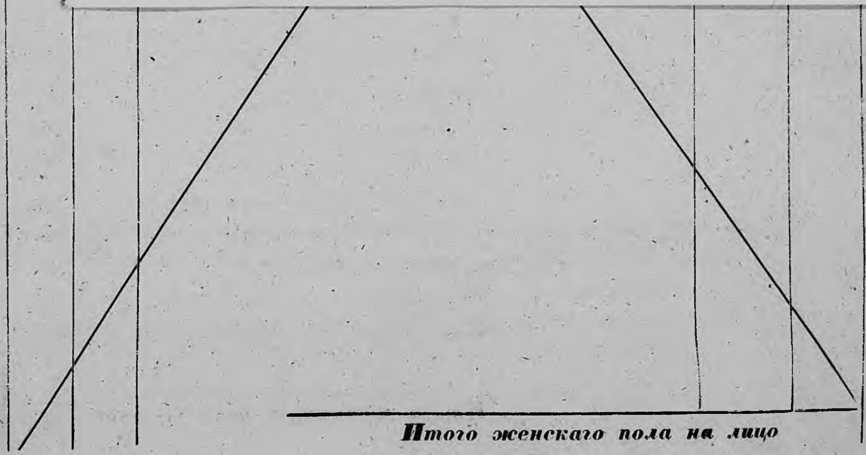
Итого женского пола на лицо