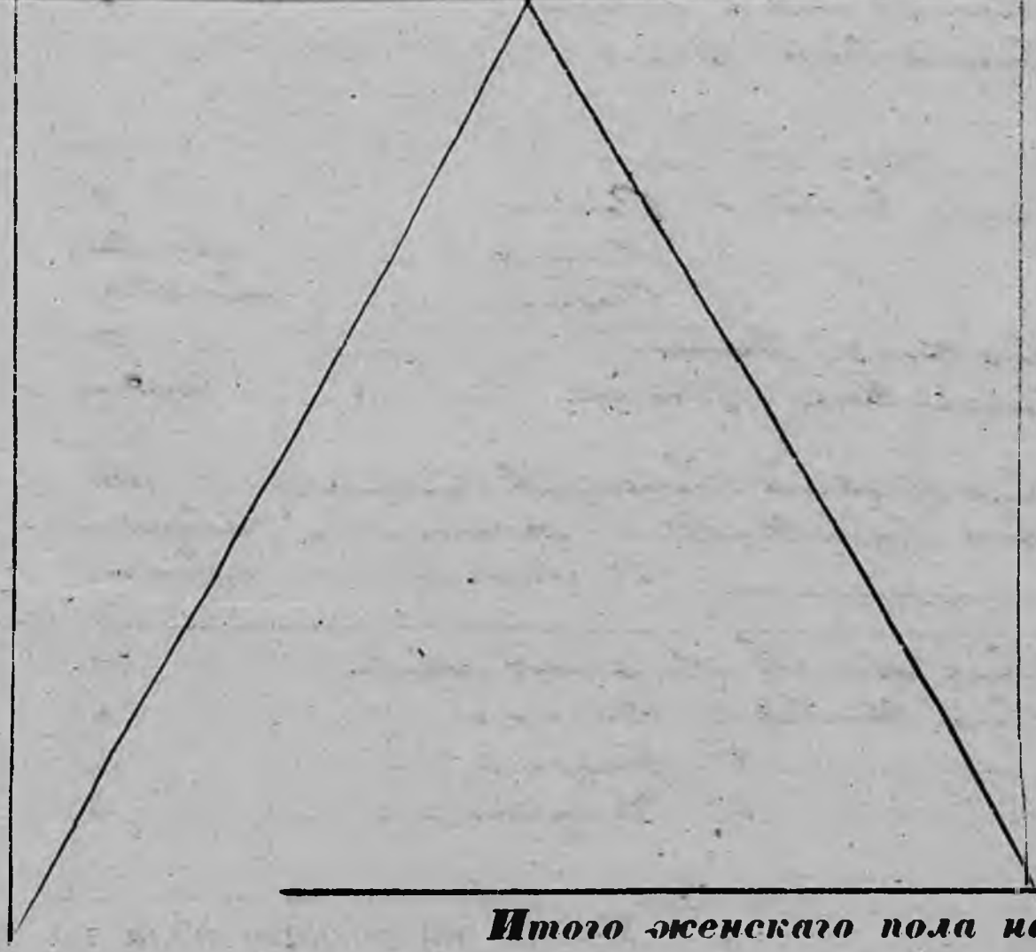
Итого женскаго пола на лицо