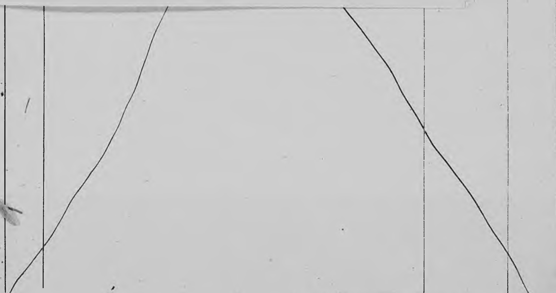
Итого женского пола на лицо.